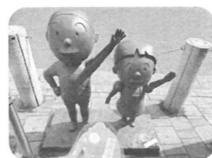
桜新町のかつおくとわかめちゃん♪