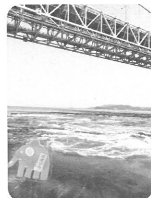
鳴門のうず潮 迫力あったゾウ〜!